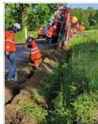
Travaux d'enfouissement pour le passage de la fibre