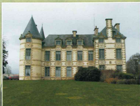
Château de Beaubois