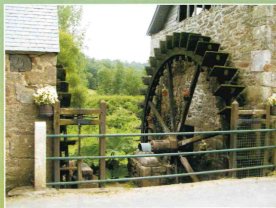
Moulin à eau du Pont Loyer